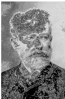
Pjotr Ilj. Tsjaikovski

“Daarentegen is de combinatie met Tsjaikovski de meest effectieve en werkt deze bijna als een trucje. Ik heb altijd gevonden dat Tsjaikovski, vooral in zijn latere jaren, in zijn pianominiaturen muzikale ideeën uitwerkt op vergelijkbare wijze als Brahms. Natuurlijk moeten we daarbij de cultuurverschillen niet uit het oog verliezen. Maar ik denk toch, dat